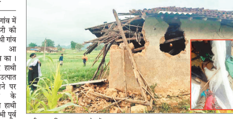
हाथी द्वारा क्षतिग्रस्त घर, इनसेट में मृतक।

चुई वन क्षेत्र के ग्राम पंचायत बंगा गांव में बीती रात उस समय अफरा तफरी की स्थिति निर्मित हो गई जब देर रात हाथी गांव में आ धमका। इधर हाथी के उत्पात मचाने के लोग हाथी को भगाने का प्रयास करने लगे तभी पूर्व चौकीदार का हाथी से आमना-सामना हो गया जिससे हाथी के हमले से पूर्व चौकीदार की मौके पर ही मौत हो गई। हैरानी की बात तो है कि क्षेत्र में लगातार हाथी निगरानी दल को हाथी का लोकेशन पता नहीं चल रहा है जिससे ग्रामीणों में आक्रोश है और वन विभाग पर अनदेखी और लापरवाही का आरोप लगाया है।