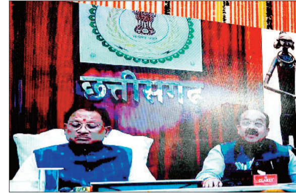
कार्यक्रम को वर्चुअली संबोधित करते मुख्यमंत्री विष्णु देव साय।

प्रदेश के मुख्य मंत्री विष्णुदेव साय ने कहा है कि छत्तीसगढ़ अपनी स्थापना के 25 वर्ष पूर्ण कर रजत जयंती वर्ष मना रहा है, जो फरवरी 2025 तक जारी रहेगा। इस दौरान अटल प्रतिभा का अनावरण प्रत्येक विभाग द्वारा साप्ताहिक कार्यक्रम आयोजित किए जाएंगे। यह अवसर छत्तीसगढ़ की गौरवशाली यात्रा का प्रतीक है। बीते 25 वर्षों में राज्य ने विकास के अनेक आयाम छुए हैं और अब हमें नए संकल्पों के साथ आगे बढ़ना है। उन्होंने सभी नागरिकों से एकजुट होकर प्रदेश को प्रगति की नई ऊंचाइयों तक पहुंचाने का आह्वान किया। सीएम श्री साय बुधवार को तिलसिवां में रजत महोत्सव के अवसर पर आयोजित कार्यक्रम को संबोधित कर रहे थे। सीएम श्री साय इस कार्यक्रम में वीडियो कांफ्रेंस के जरिए शामिल हुए। सीएम ने मुख्यमंत्री ने सूरजपुर के नए बस स्टैंड स्थित अटल परिसर में भारत रत्न स्व. अटल