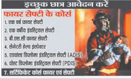
इच्छुक छात्र आवेदन करें फायर सेफ्टी के कोर्स

औद्योगिक सुरक्षा की नियुक्ति फायर स्टेशन, कारखाने, खदानों, माइनिंग, पावर प्लांट, कागो हब फैक्ट्री कारखाने सरकारी एजेंसी, इश्योरेंस कंपनी एवं अन्य जगहों में फायर अधिकारी, ट्रेनर, फायरमैन, औद्योगिक सुरक्षा निरीक्षक, सेफ्टी मैनेजर, फायर सुपरवाइजर, टीम लीडर जैसे अन्य पदों हेतु अवसर मिलते हैं तथा भविष्य में पदोन्नति की भरपूर संभावनाएं होती हैं साथ ही फायर एवं सेफ्टी ऑफिसर स्वयं रोजगार के लिए समर्थ होते हैं अनुमानित जानकारी के अनुसार छत्तीसगढ़ राज्य में बने नए जिलों में अनुमानित लगभग 2000 पद फायरमैन एवं अग्निशमन वाहन चालक की भर्तियां आने की